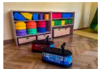
Rutschfahrzeuge, Stapelsteine & Softbausteine