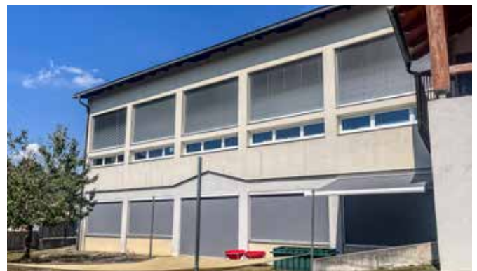
Sonnenschutzsystem im Erdgeschoß für Bewegungsraum und Markise (rechts am Bild)

Ein Dankeschön an das Kindergartenteam sowie die Gemeindeglieder für die Umsetzung der notwendigen Arbeiten!