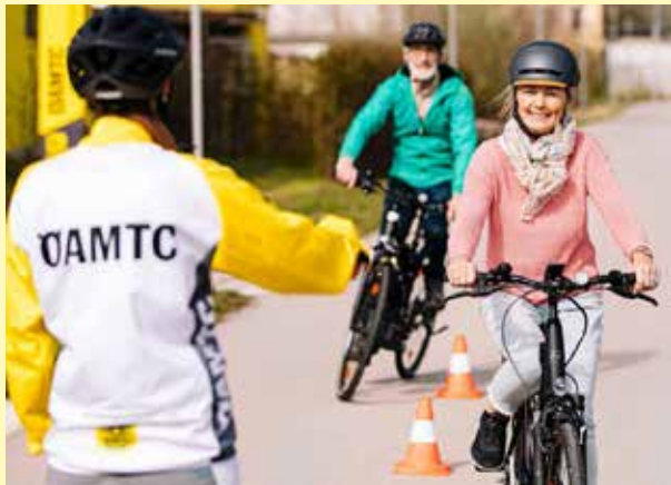
E-Bike Kurs